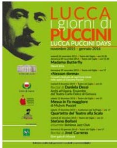
n. 44 del 4/11/2015