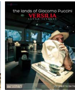
n. 38 del 30/10/2015