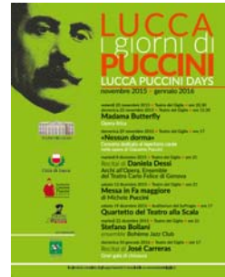
20 novembre 2015 26 novembre 2015