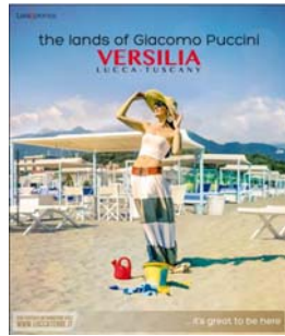
n. 32 del 12/8/2015