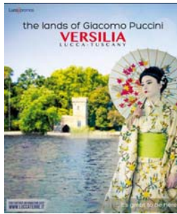
n. 34 del 26/8/2015