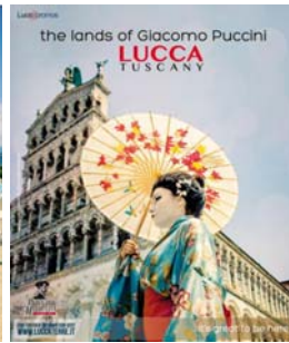
Guida Verde Touring gennaio 2016