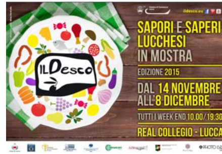
20 novembre 2015 26 novembre 2015