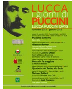
n. 47 del 20/11/2015