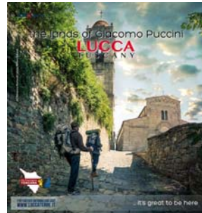
n. 49 del 4/12/2015