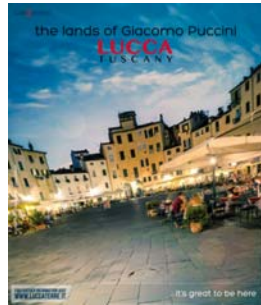
n. 42 del 21/10/2015