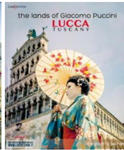
n. 36 del 9/9/2015