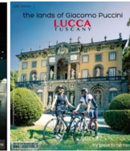
n. 40 del 19/10/2015