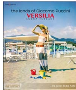
Rivista Touring settembre 2015